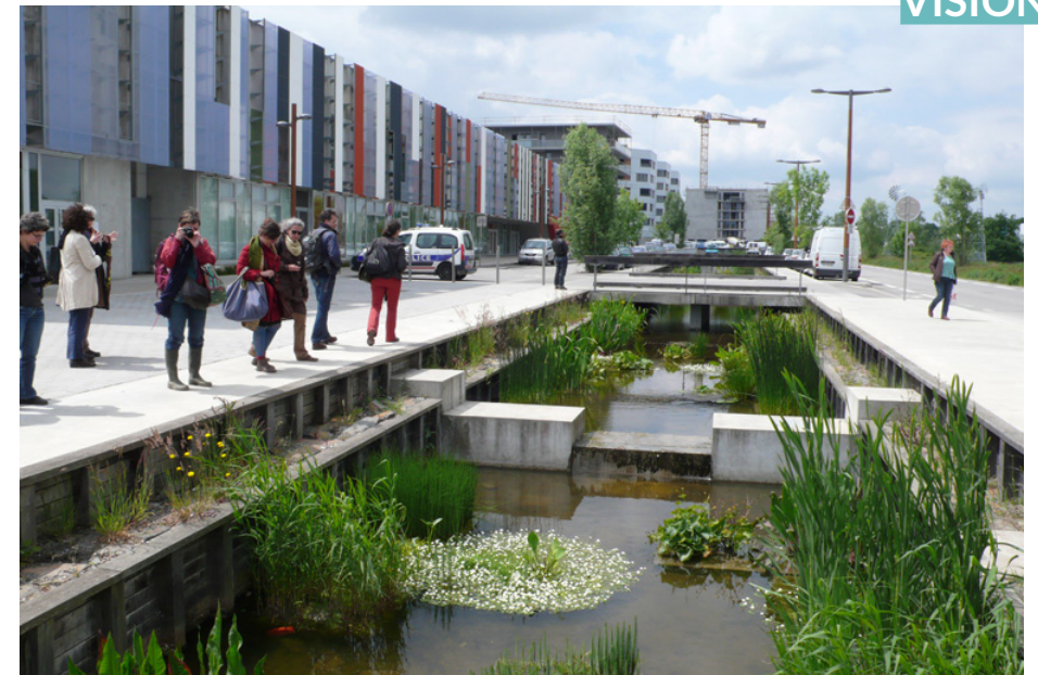
Bottière-Chénaie ecodistrict, Nantes