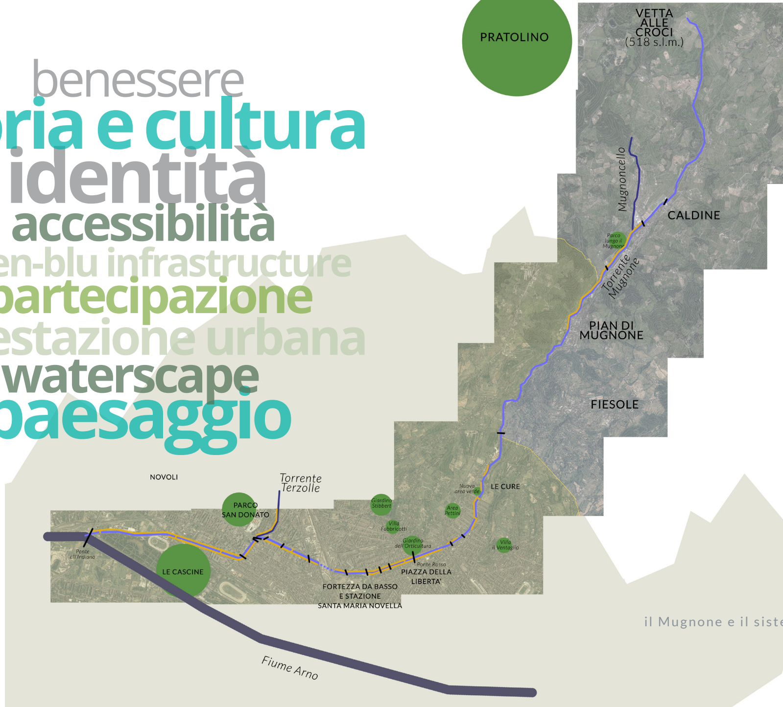
il Mugnone e il sistema dei percorsi