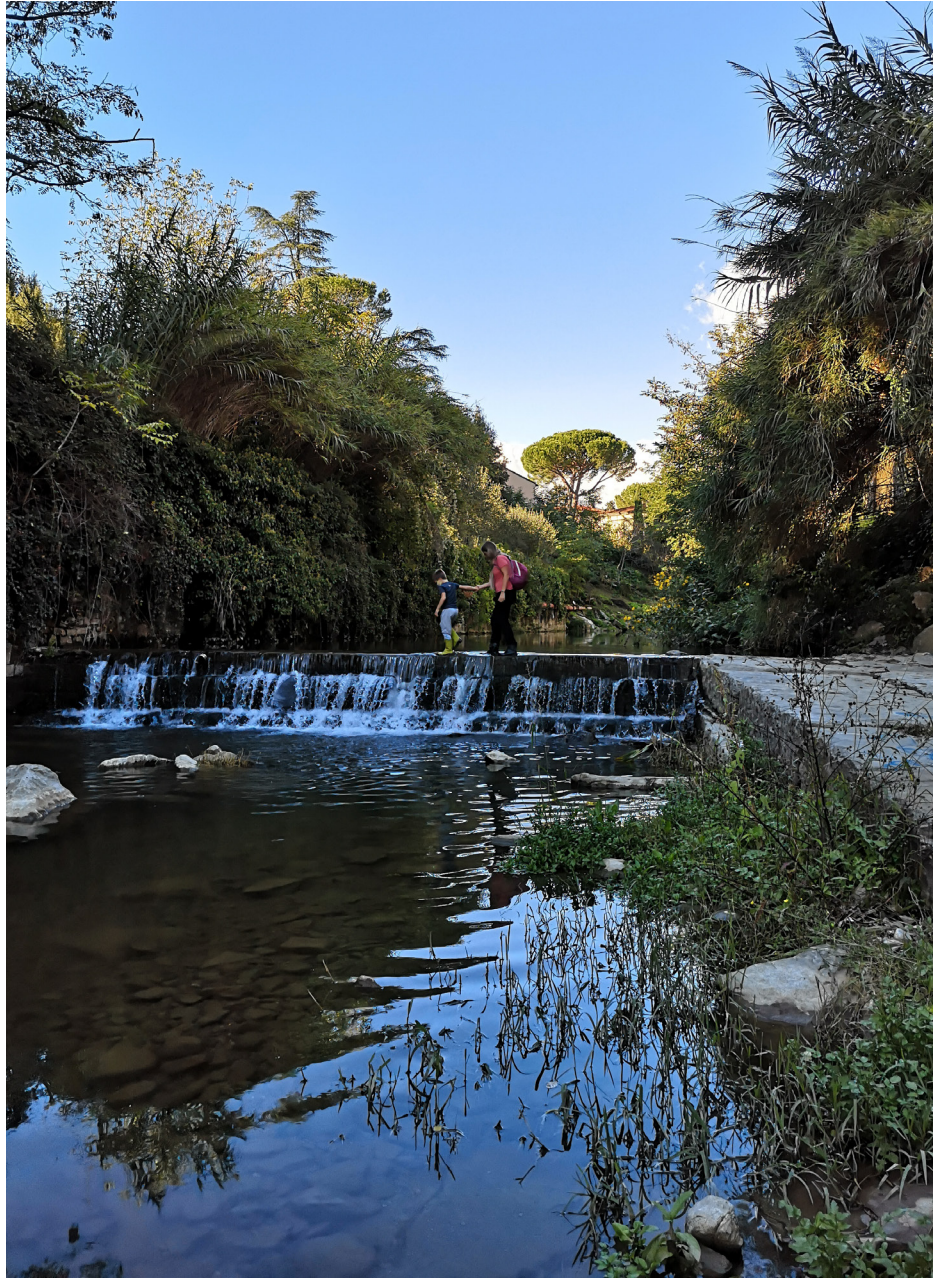
Torrente Mugnone, Firenze