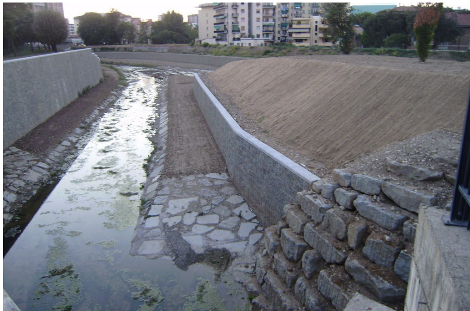
Torrente Mugnone, Firenze